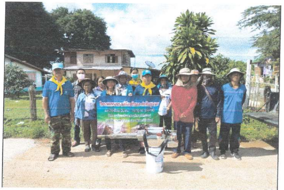
รายงานผลการติดตามและประเมินผลแผนพัฒนาองค์การบริหารส่วนตำบลวังโรงใหญ่ ประจำปี ๒๕๖๖