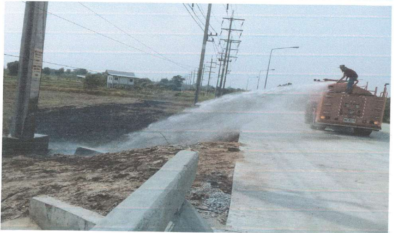
รายงานผลการติดตามและประเมินผลแผนพัฒนาองค์การบริหารส่วนตำบลวังโรงใหญ่ ประจำปี ๒๕๖๖